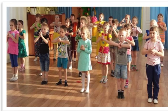
Вокалотерапия в МБДОУ № 279