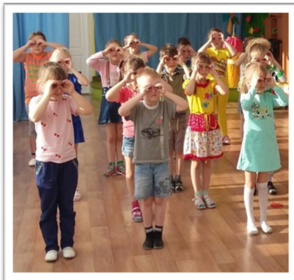
Вокалотерапия на музыкальном занятии

Использование технологии вокалотерапия помогают дошкольнику: снизить уровень легочных и простудных заболеваний; снизить уровень тревожности; способствуют познанию окружающего мира, снижают уровень психоэмоционального и психомышечного напряжения.