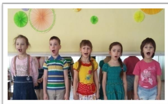
Вокалотерапия в детском саду

Снижение психоэмоционального напряжения педагогов – важная задача в коллективе. Заниматься успокаивающей психотехникой необходимо ежедневно. Уже через несколько дней вы почувствуете себя спокойнее, увереннее, более неуязвимыми для стресса.